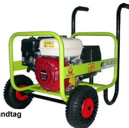
Varenr. 1480090 Kørestel med faste håndtag