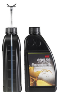
Varenr. 1480200 Generator Olie